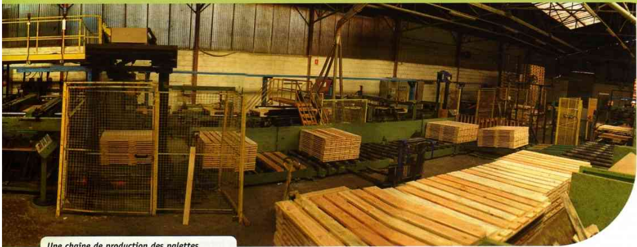
Une chaîne de production des palettes