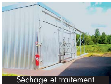
Séchage et traitement